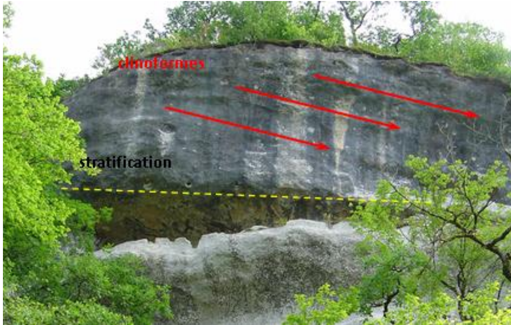
Figure 3 : Cliniformes obliques dans les calcaires gréseux de la base de la 2 ème séquence attestant de la progradation de la plate-forme au Coniacien (Formation des Eyzies)

Sur les fonds sableux vivaient de nombreux organismes benthiques 5 : échinodermes, brachiopodes, lamellibranches et bryozoaires, qui ont donné naissance par niveaux à de fortes bioturbations 6 .