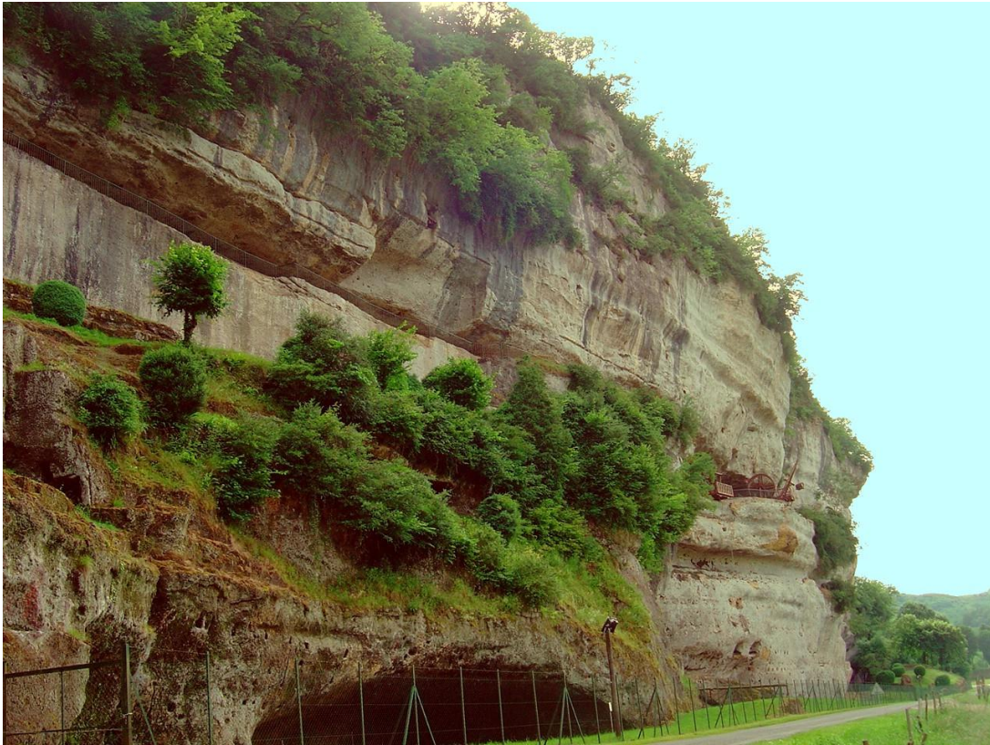
Figure 2 : Falaise calcaire karstifiée du Coniacien moyen à la Roque Saint-Christophe

dans la ligne d'abri sous roche, en retrait, qui coupe horizontalement la falaise à mi-hauteur.