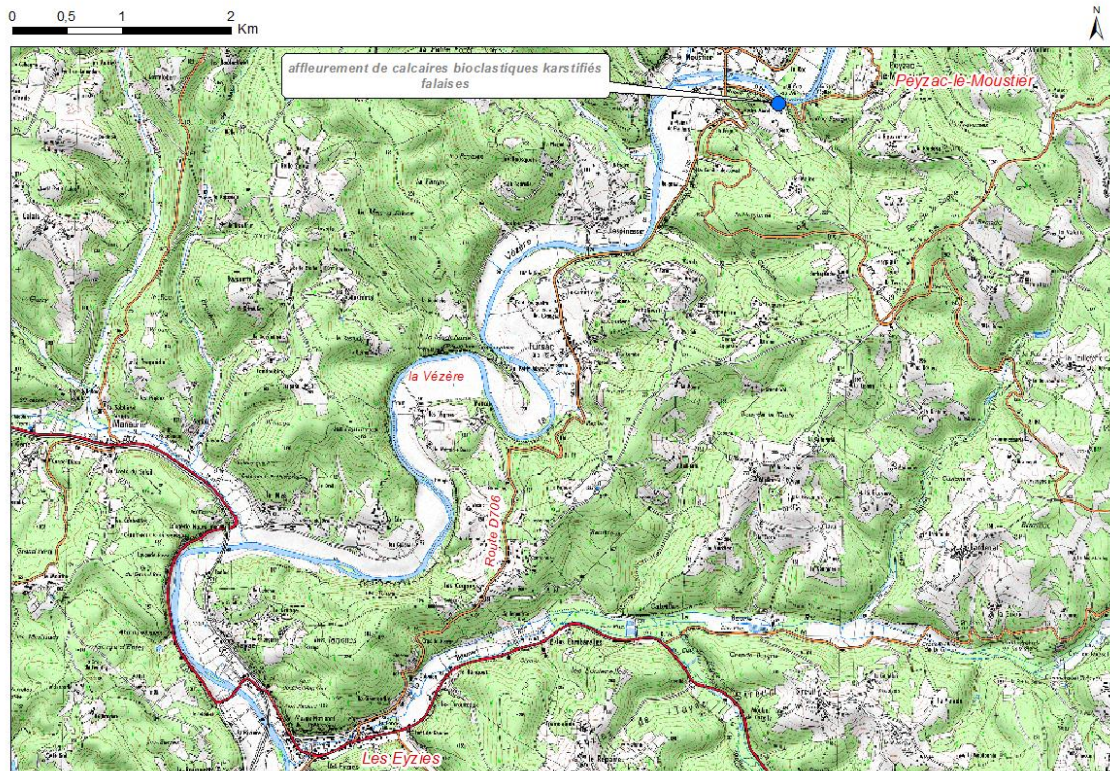
Figure 1 : Localisation de la falaise de la Roque-Saint-Christophe

En venant des Eyzies au sud, par la Route D706 qui suit la vallée de la Vézère, il faut tourner vers l'est juste avant le pont qui arrive au Moustier ( figure 1 ). On longe le bas de l'imposante falaise de la Roque Saint-Christophe pour accéder à un parking. On poursuit la petite route à pied après le virage sur 200 m pour arriver à un petit belvédère en face de la falaise.