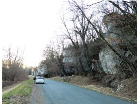
2-Falaise de calcaire du Coniacien