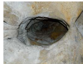
8-Puits karstique vu d'en dessous