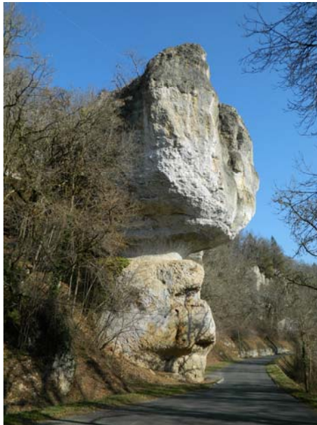
4-Rocher du Fourneau du Diable

Autour de la commune de BOURDEILLES, Falaises du Fourneau du Diable