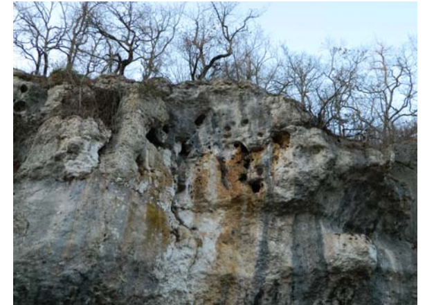
3-Karsts dans les calcaires du Coniacien moyen, les Genêts

Autour de la commune de BOURDEILLES, Falaises du Fourneau du Diable