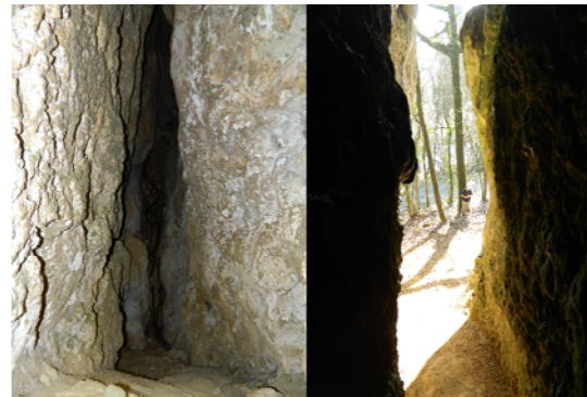
5-vue intérieure et extérieure