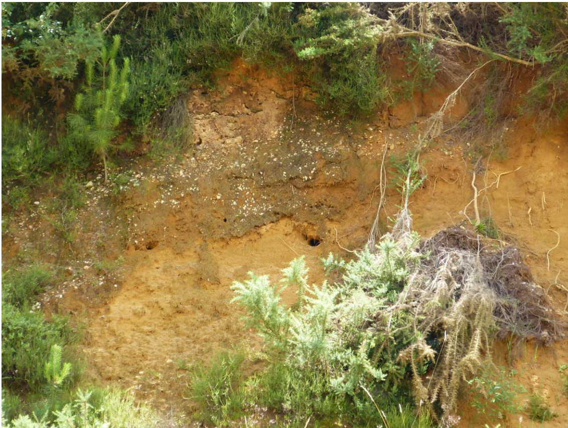
Figure 1 : Front de l'ancienne sablière du ruisseau de Libé (© Platel JP., 2015).

Sur plusieurs mètres d'épaisseur, les Sables fauves du Serravallien (Miocène moyen) affleurent sur le front de la sablière. Ils sont constitués de sables micacés ferruginisés, très fins, bien classés et légèrement argileux kaolinitiques (médiane : 150 à 250 \mu\text{m} ), de couleur roux-orangé. Des lits de graviers centimétriques existent, déposés dans des chenaux (figure 1). La couleur caractéristique de ces sables résulte des intenses altérations sous climat intertropical, qui ont fortement transformé ces sédiments par oxydation des minéraux ferrifères.