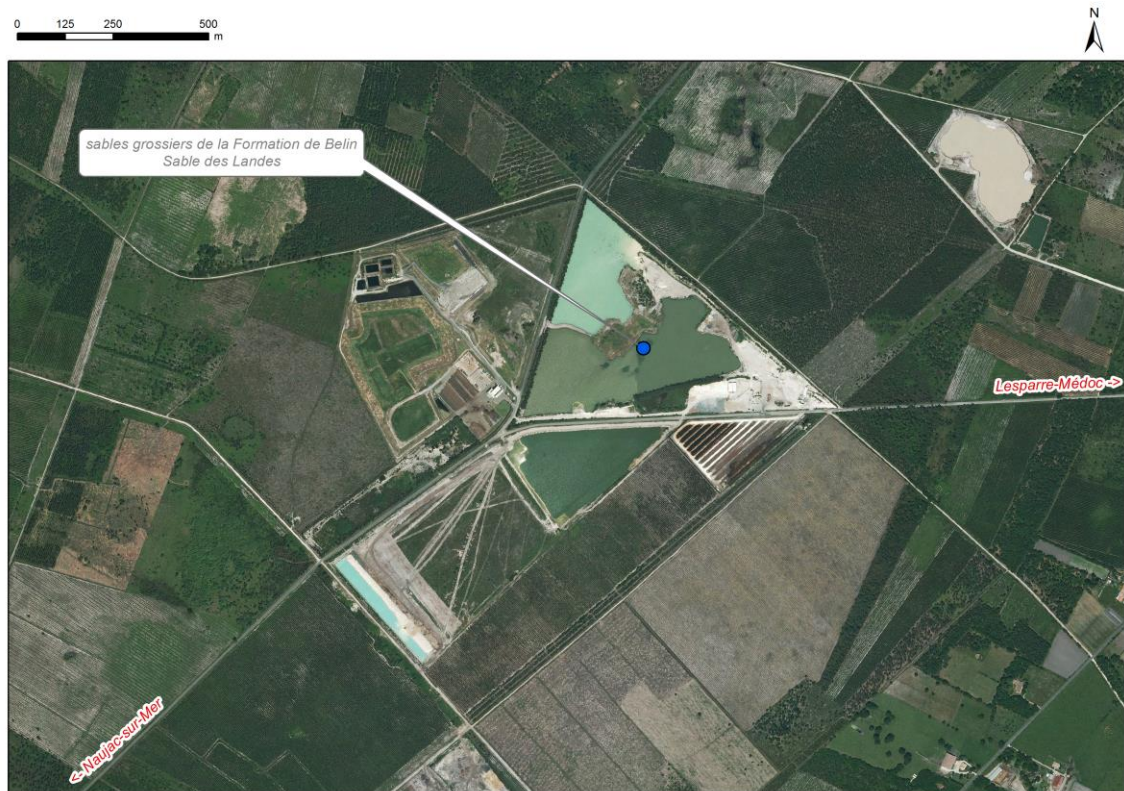
Localisation des affleurements décrits