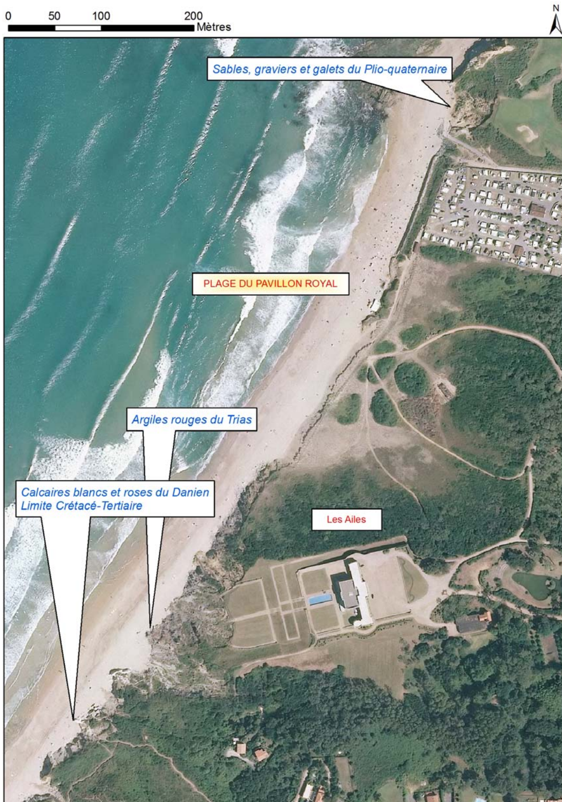
Localisation des affleurements décrits