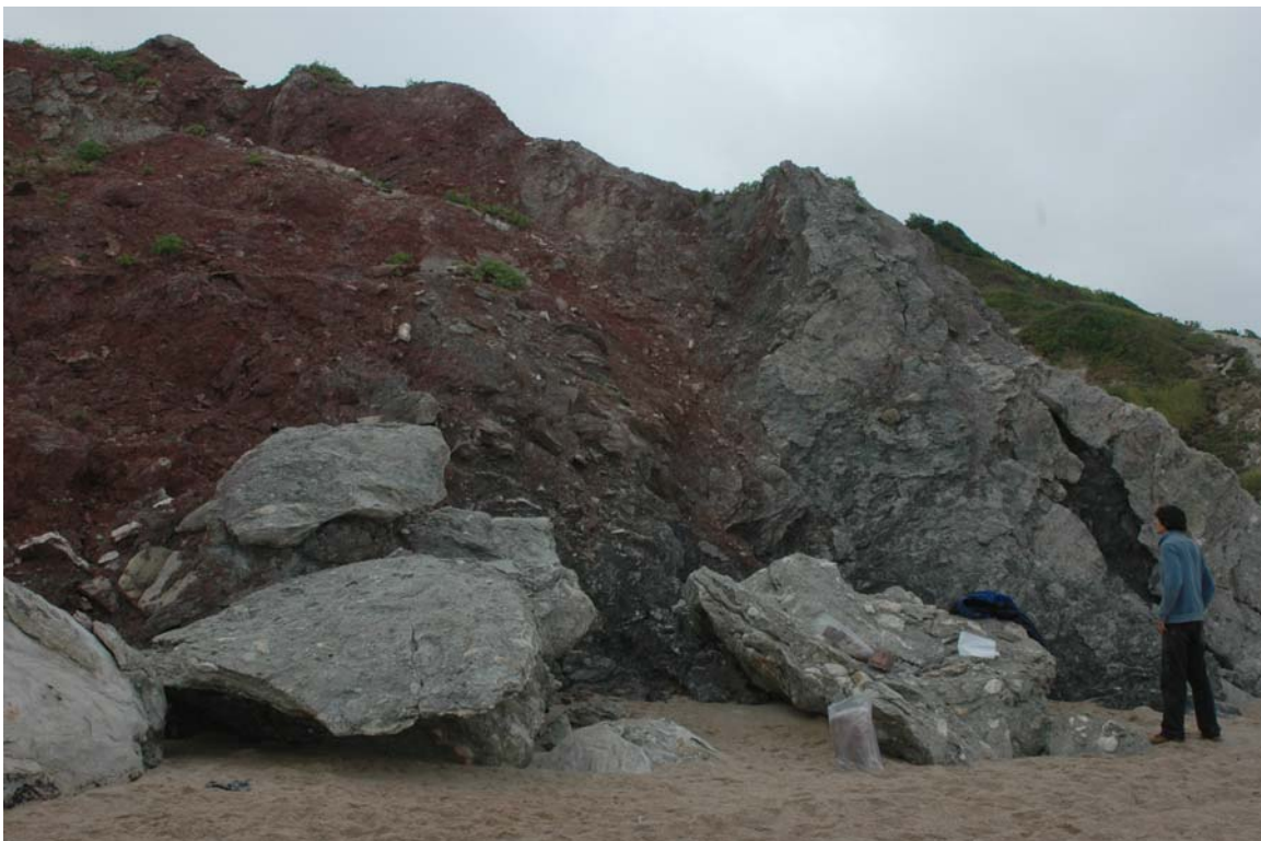
Figure 1 : Affleurement des marnes à gypse triasiques (Bidart, Plage du Pavillon Royal)

Pour plus de détails sur la Géologie du Pays Basque, se reporter à la fiche « Balade hydrogéologique du pays Basque - Introduction ».