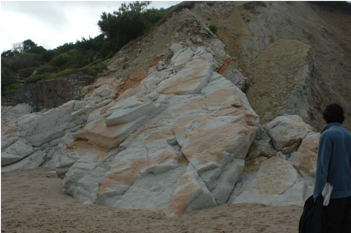
Figure 2 : Calcaire rose du Danien - Plage du Pavillon Royal à Bidart

L'essentiel de la déformation pyrénéenne s'est produit entre l'Yprésien (Eocène inférieur) et l'Oligocène, ce qui implique que le Paléocène peut être considéré comme anté-tectonique.