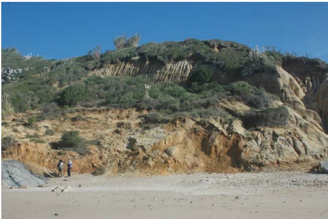
Figure 4 : Formations plio-quaternaires sableuses - Plage du Pavillon Royal à Bidart

Les formations plio-quaternaires affleurent aussi au Pavillon Royal ( figure 4 ). La plage se situe majoritairement à l'extrémité d'une dépression fermée qui a piégé, par ses effets d'effondrement, des sables fluviaux à la base et des sables éoliens en son sommet . Des intercalaires ligniteux sont parfois visibles, en fonction de l'érosion saisonnière que subit la plage.