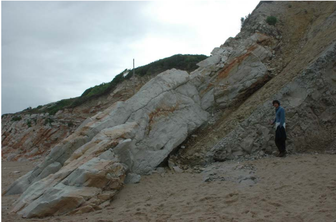
Figure 3 : Affleurement de la limite KT (limite Crétacé-Tertiaire) et du calcaire rose du Danien sur la plage du Pavillon Royal à Bidart

Les formations plio-quaternaires affleurent aussi au Pavillon Royal ( figure 4 ). La plage se situe majoritairement à l'extrémité d'une dépression fermée qui a piégé, par ses effets d'effondrement, des sables fluviaux à la base et des sables éoliens en son sommet . Des intercalaires ligniteux sont parfois visibles, en fonction de l'érosion saisonnière que subit la plage.