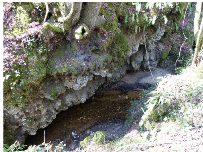
Figure 2 : Calcaires karstifiés du Maastrichtien, entaillés par le ruisseau du Cros (Platel JP., 2014)