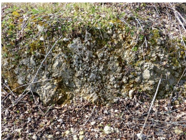
Figure 1 : Calcaires recristallisés du Maastrichtien (Platel JP., 2014)

Les forages de captage d'eau potable de Roquefort ont touché la formation maastrichtienne à partir de + 51 et +38 m NGF, la différence de profondeur résultant de l'effet du fort pendage des terrains vers le sud. Les forages de captages d'Arue l'ont touché à partir de + 52 et + 24 m NGF, cette différence témoignant là-aussi des nets effets du pendage entre ces forages sur le flanc nord de l'anticlinal.