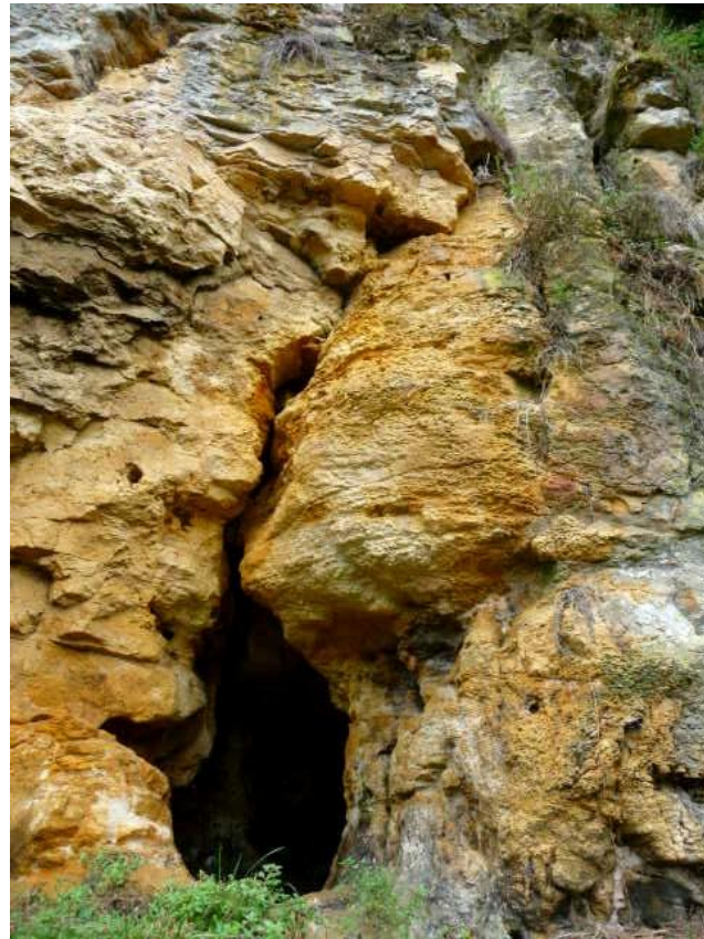
Figure 3 : Conduit karstique sur fracture tectonique dans le niveau inférieur