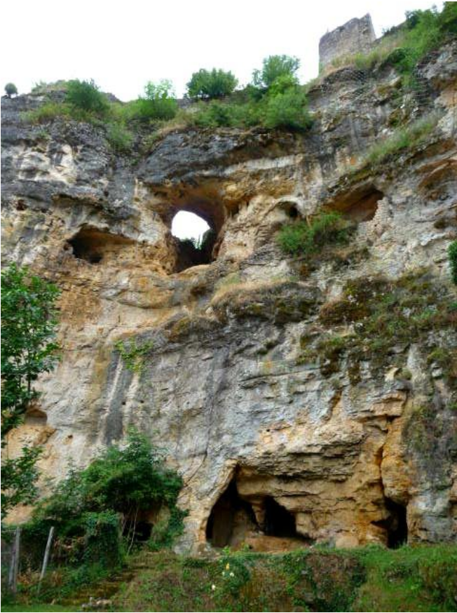
Figure 1 : Massif calcaire très karstifié du Coniacien moyen sous l'ancien château de Cuzorn