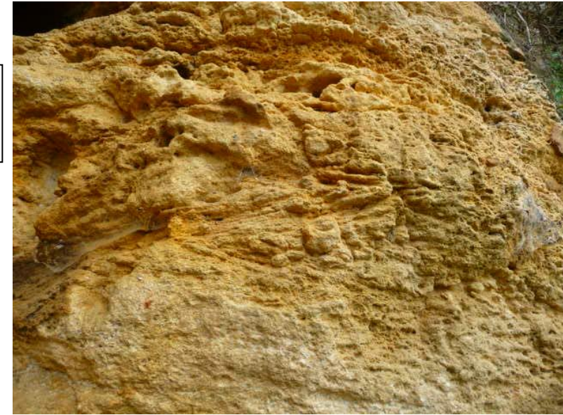
Figure 2 : Stratifications obliques dans les calcaires coniaciens attestant de forts courants sur la plate-forme