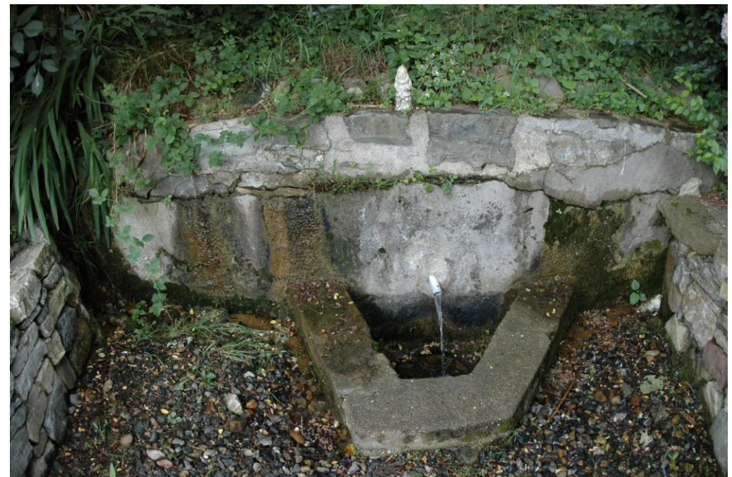
Figure 3 : Source aménagée, au nord-ouest de la source Contresta