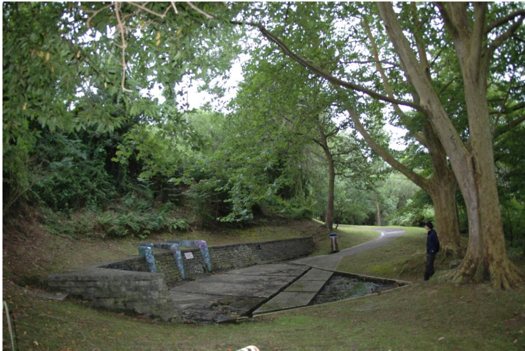
Figure 1 : Source Contresta à Bidart