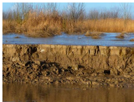
Figure 2 : Argiles brunes de l'Holocène et vases récentes, au nord de l'île