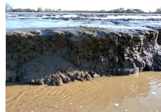
Figure 3 : Argiles gris-bleu de l'Holocène et dépôt de vases récentes, autour de la réculée d'érosion, entre les deux parties au nord de l'île

La remarquable constance de la température autour de 15,4°C, tant en été qu'en fin d'automne, atteste de l'absence de communication entre les eaux de l'estuaire et celle de la nappe.