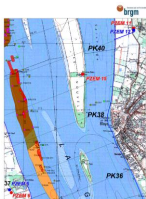
Figure 1 : Localisation du PZEM 15 (© Platel JP., 2015)

Dans les petites "falaises", entaillées par la reprise d'érosion, au nord de l'île, on voit nettement les argiles flandriennes bioturbées ( figure 2 ), mais compactes, intercalées avec des sables argileux, sous une vingtaine de centimètres de dépôts lités, très récents, meubles, qui résultent de la sédimentation actuelle.