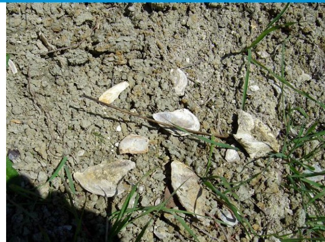
Figure 4 : Débris de coquilles d' Ostrea aginensis (Platel JP., 2014)