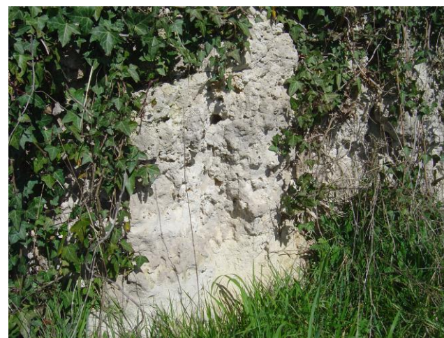
Figure 5 : Calcaire gris de l'Agenais (Platel JP., 2014)