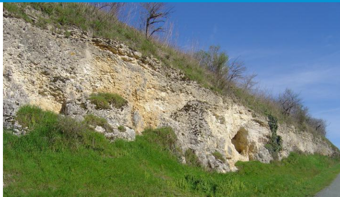
Figure 1 : Calcaire blanc de l'Agenais (Platel JP., 2014)