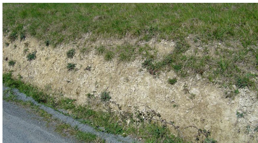
Figure 3 : Marnes à Ostrea aginensis (Platel JP., 2014)