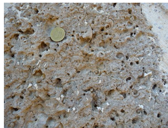
Figure 6 : Détail du faciès du Calcaire gris pétri de gastéropodes d'eau douce (Platel JP., 2014)