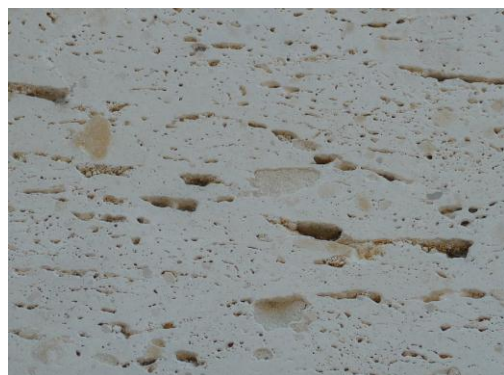
Figure 2 : Détail du faciès du Calcaire blanc à vacuoles (Platel JP., 2014)