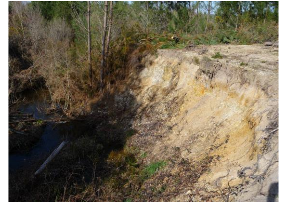
Figure 3 : Coupe des alluvions, au pont de la route D105, entaillées par le ruisseau de la Cabaleyre.