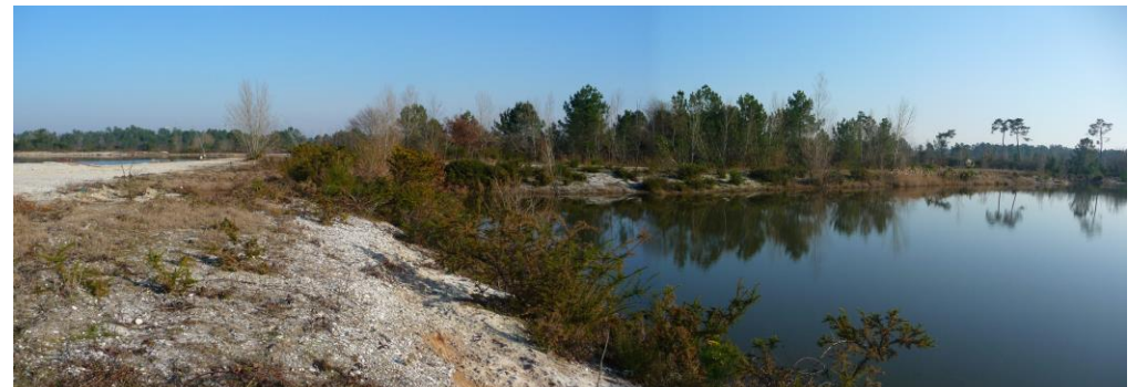
Figure 5 : Niveau de la nappe d'eau dans l'ancienne gravière de Casalié.