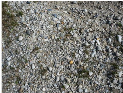
Figure 2 : Galets de quartz et de quartzites de la terrasse du Mindel.