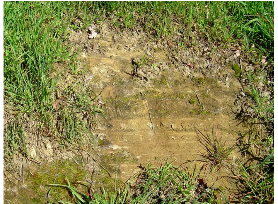
Figure 2 : Détail d'un talus gréseux, près de Gal de Cambes (Platel JP., 2014)