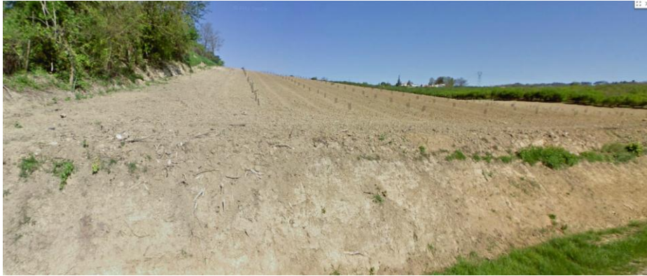
Figure 1 : Affleurement de Villotte, en bordure de la route, en rive droite du Tolzac (Platel JP., 2014)